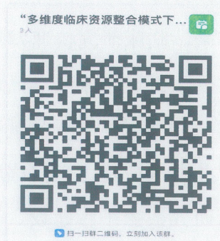
图2学员钉钉群二维码